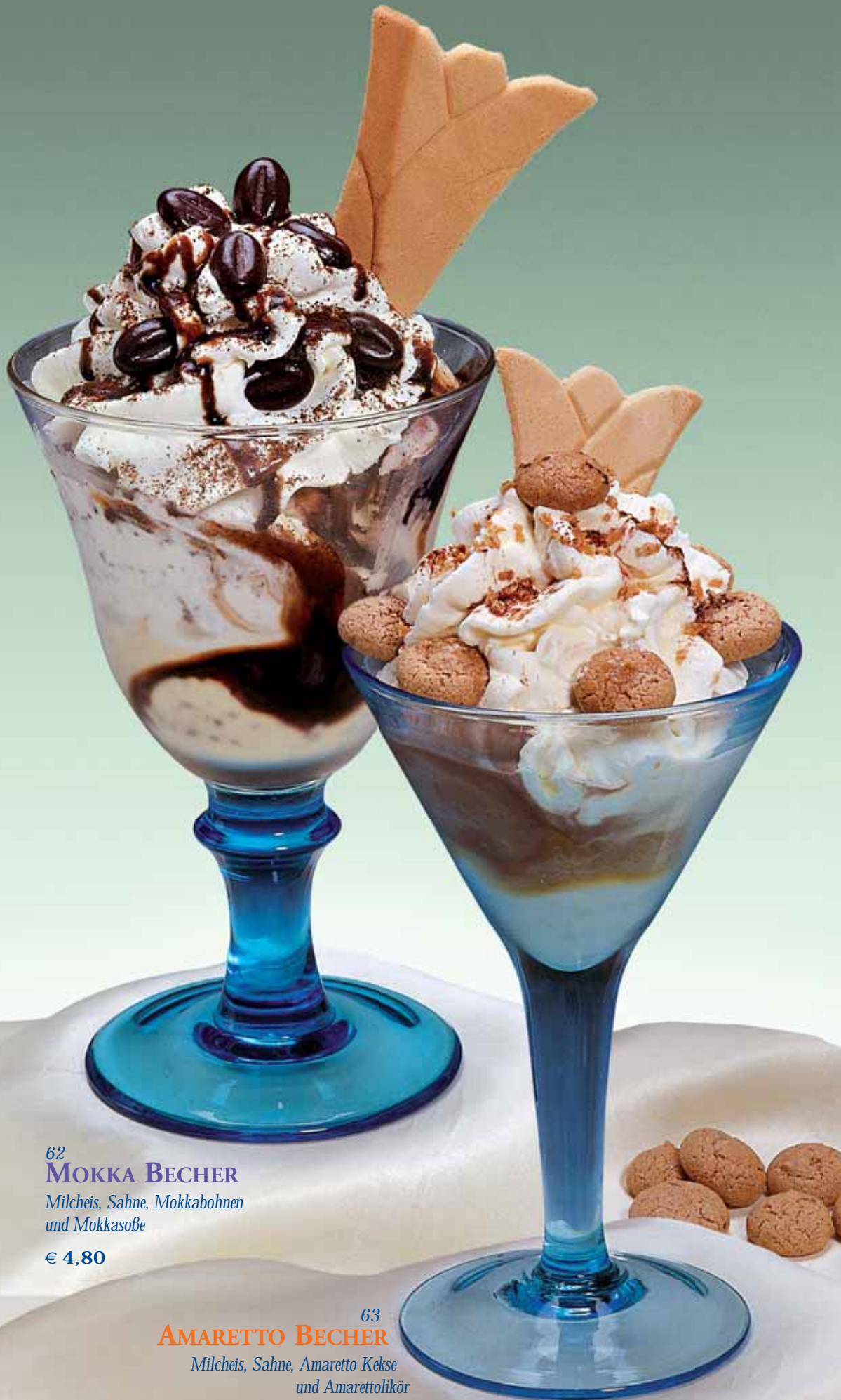
62 MOKKA BECHER Milcheis, Sahne, Mokkabohnen und Mokkasöße