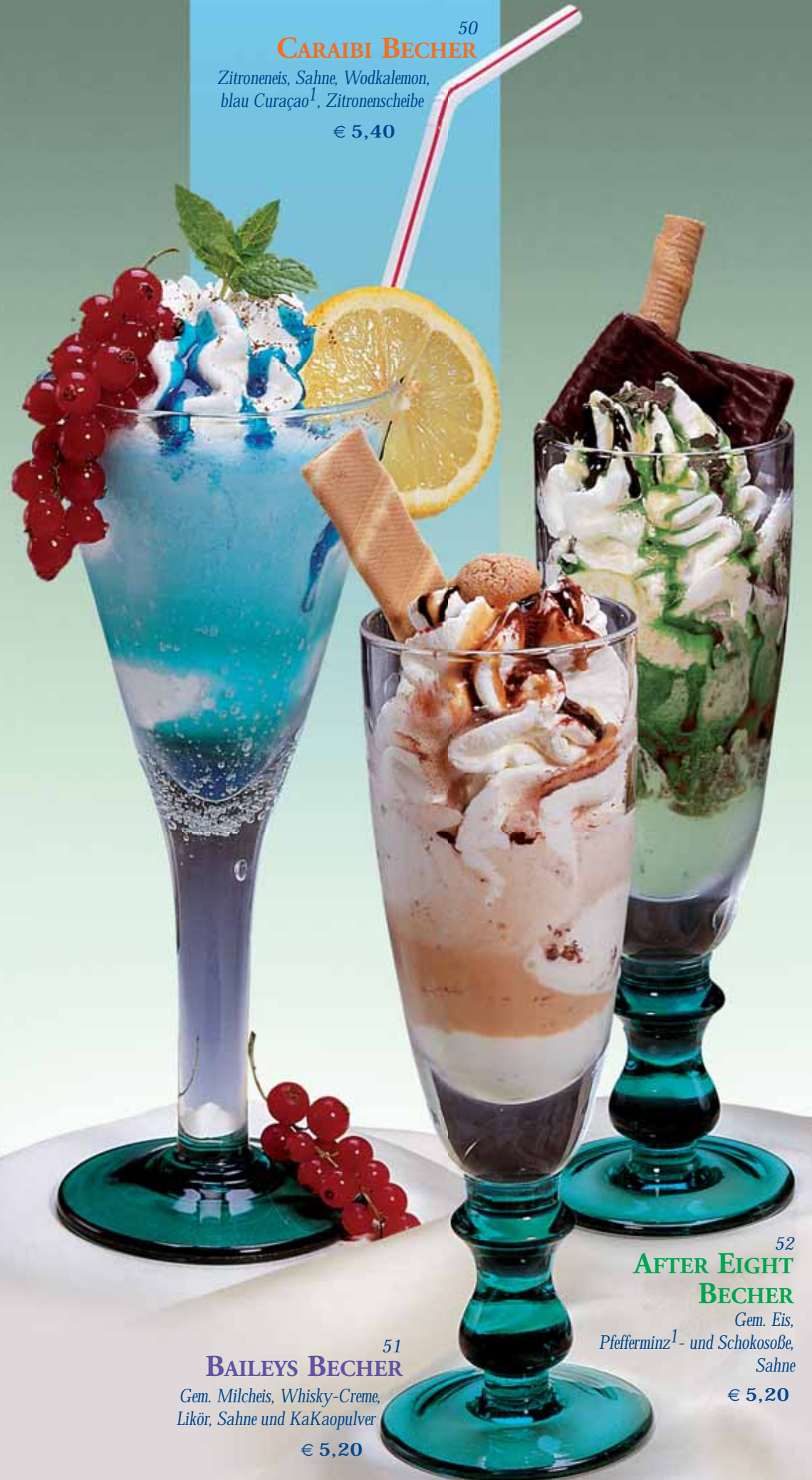
52 AFTER EIGHT BECHER

Gem. Eis, Pfefferminz 1 - und Schokosöße, Sahne